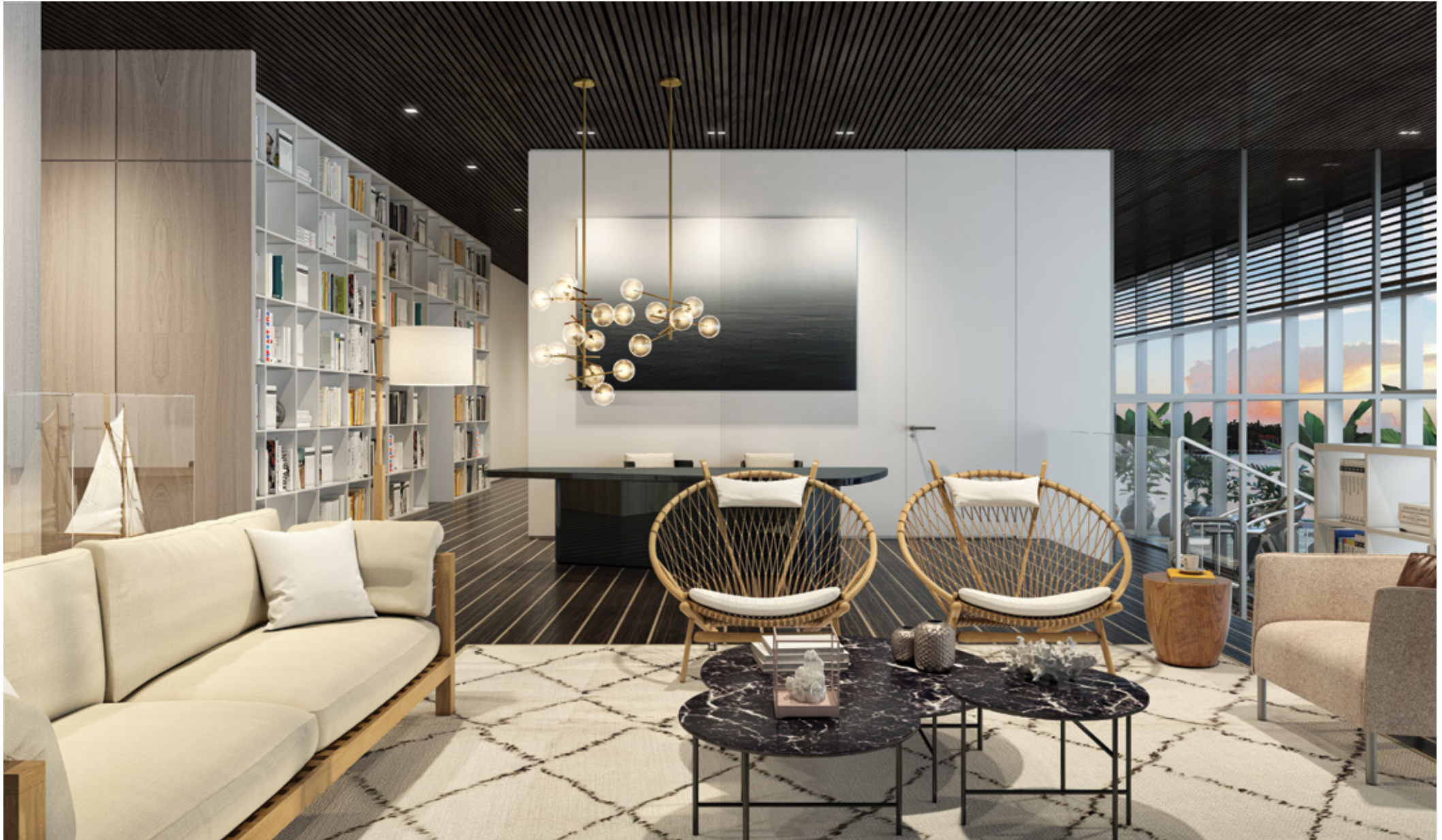
Áreas de la recepción y el lobby inspiradas en la Côte d'Azur, curado por Lissoni®