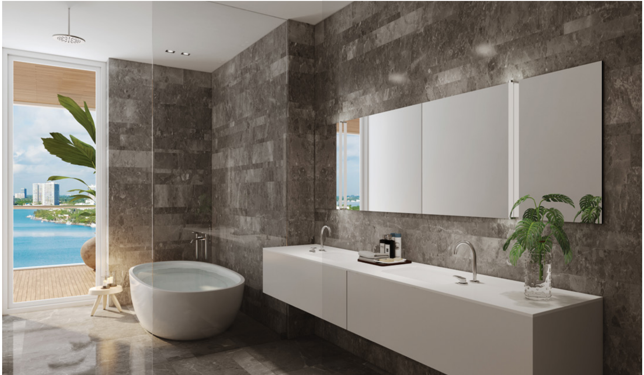
Bañeras profundas, áreas húmedas con paneles de vidrio sin marco, duchas con efecto lluvia, pisos y paredes de mármol importado que ofrecen silencio y tranquilidad a los baños principales.