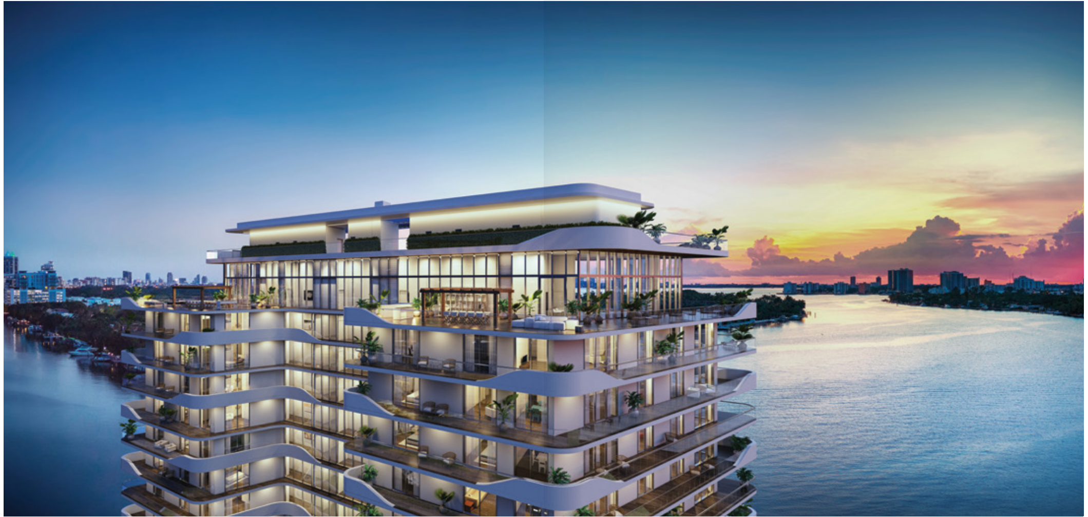
Dos penthouses que ocupan medio piso, cuentan con amplias terrazas que enmarcan la vista panorámica de Biscayne Bay y el Océano Atlántico.