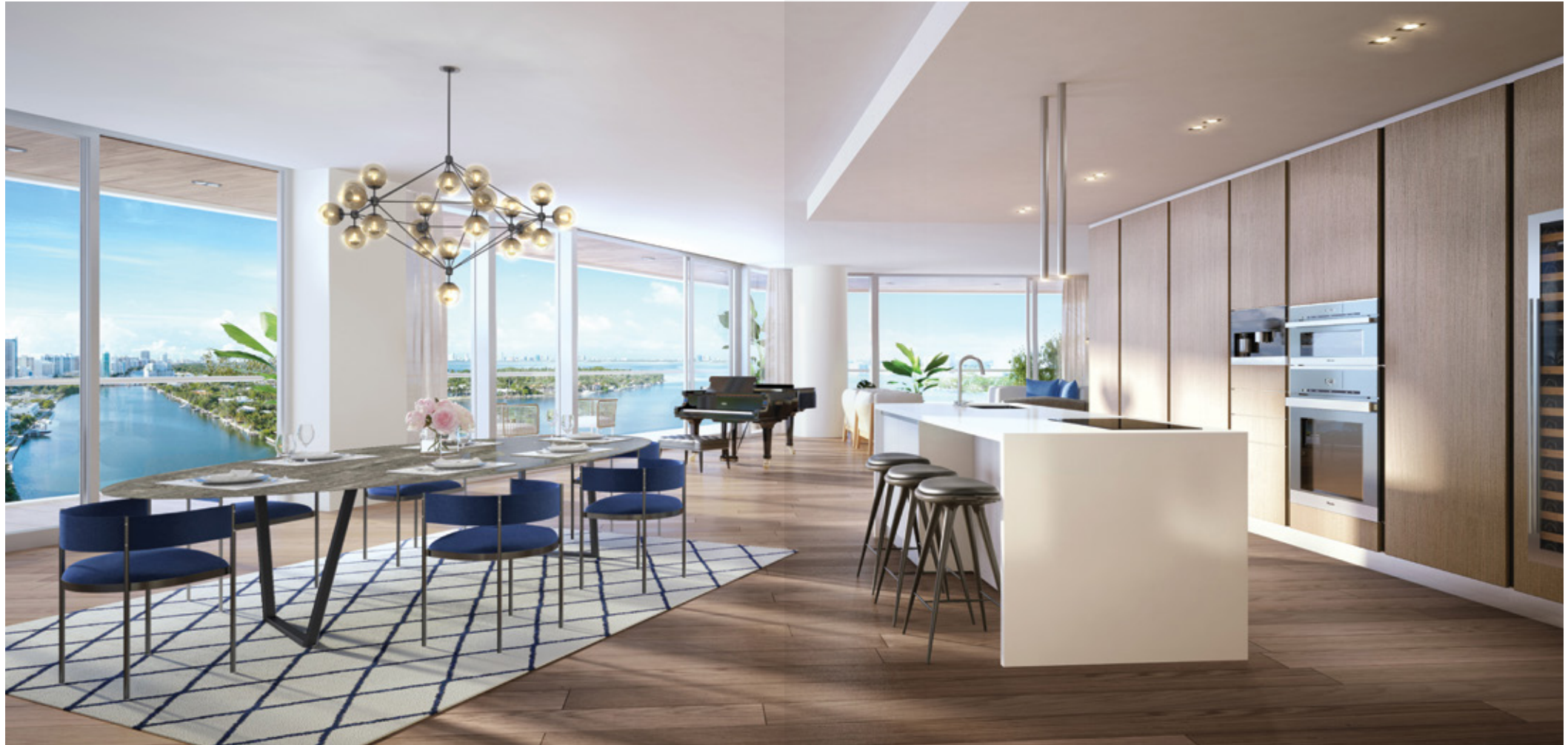
Boffi® contemporary, las cocinas italianas cuentan con mesones de piedra natural y electrodomésticos Miele®, que incluyen cafeteras empotradas y bodega para vinos.