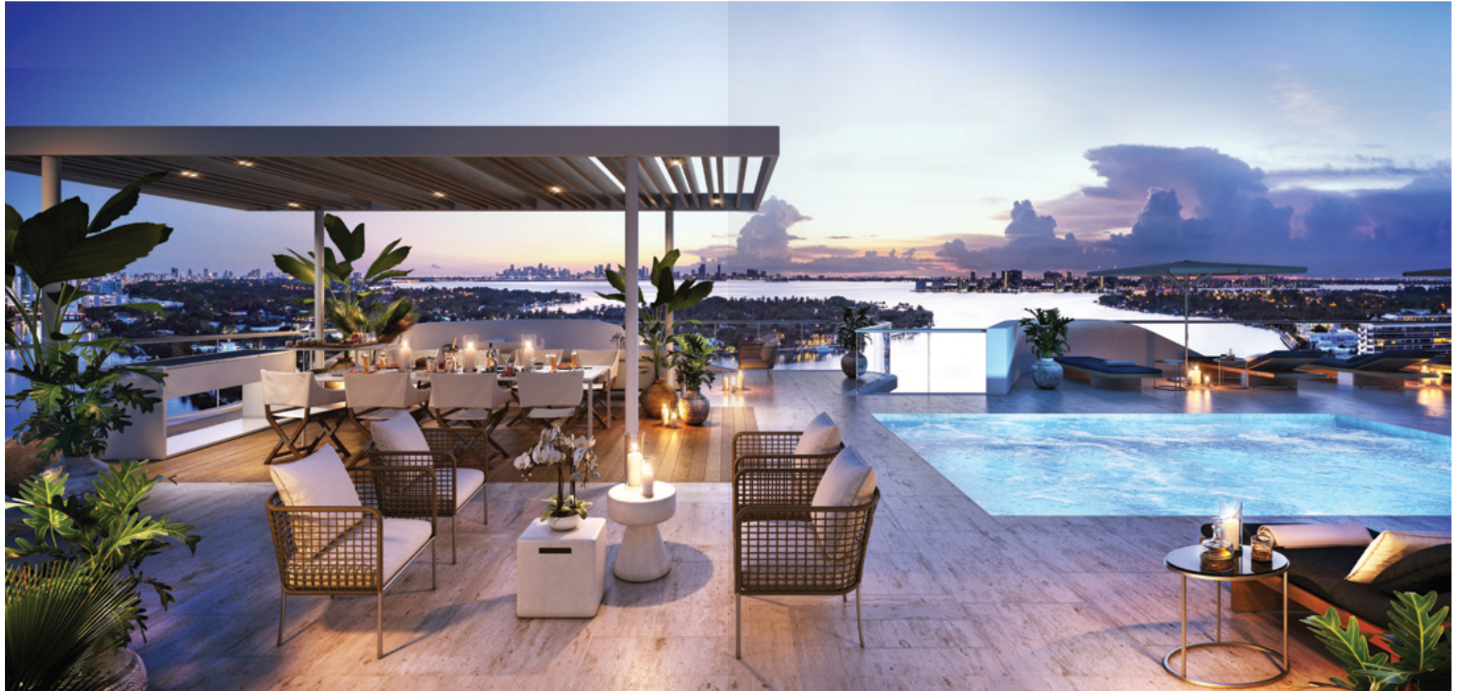
Piscina en la azotea, jacuzzi, áreas de esparcimiento privadas para tomar el sol, parrilla y una mesa de chef para entretener a los invitados.