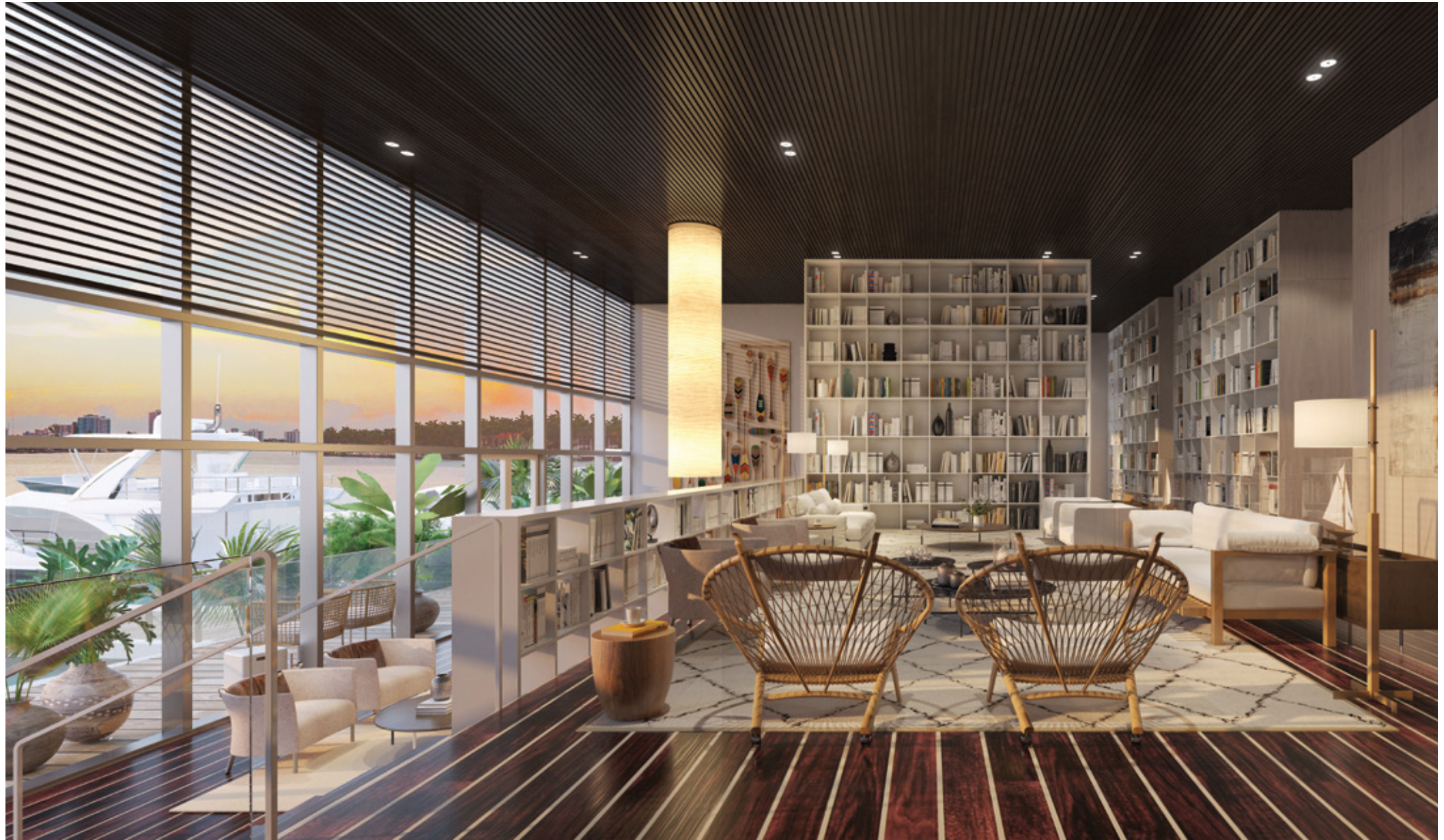
El lobby de doble altura, cuenta con ventanales del piso al techo que enmarcan la vista magnífica del intercoastal y la marina privada.